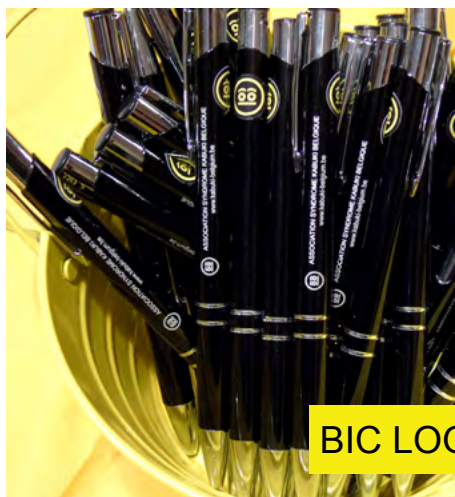
BIC LOGOTÉ 2€