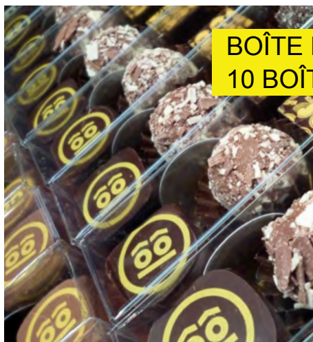
BOÎTE DE 5 PRALINES 5€ 10 BOÎTES 40€