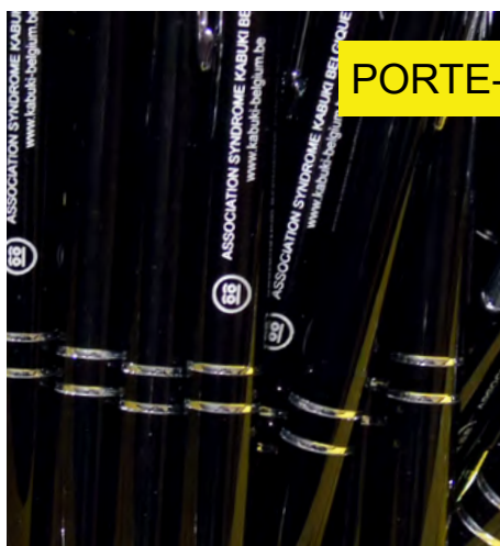
PORTE-CLÉ PIÈCE CADDY 3€50